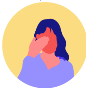
Dolor de cabeza

En caso de tener dificultad para respirar , acude a un médico.