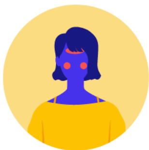
Fiebre sobre 37,8°

Los siguientes síntomas se puede dar juntos, o por separado: