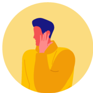
Dolor de garganta